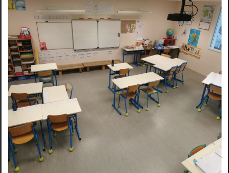
Classe des CE2/CM1/CM2

Un parc de jeux et un City à proximité, permettant d'y faire quelques récréations et le sport.