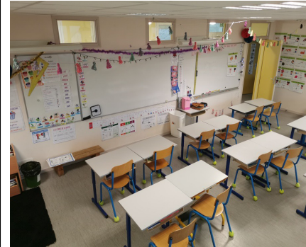
Classe des CP/CE1/CE2