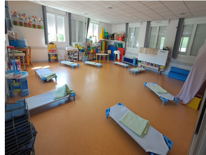
Salle de motricité et salle de sieste des maternelles