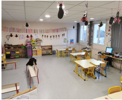
Classe des TPS/PS/MS/GS